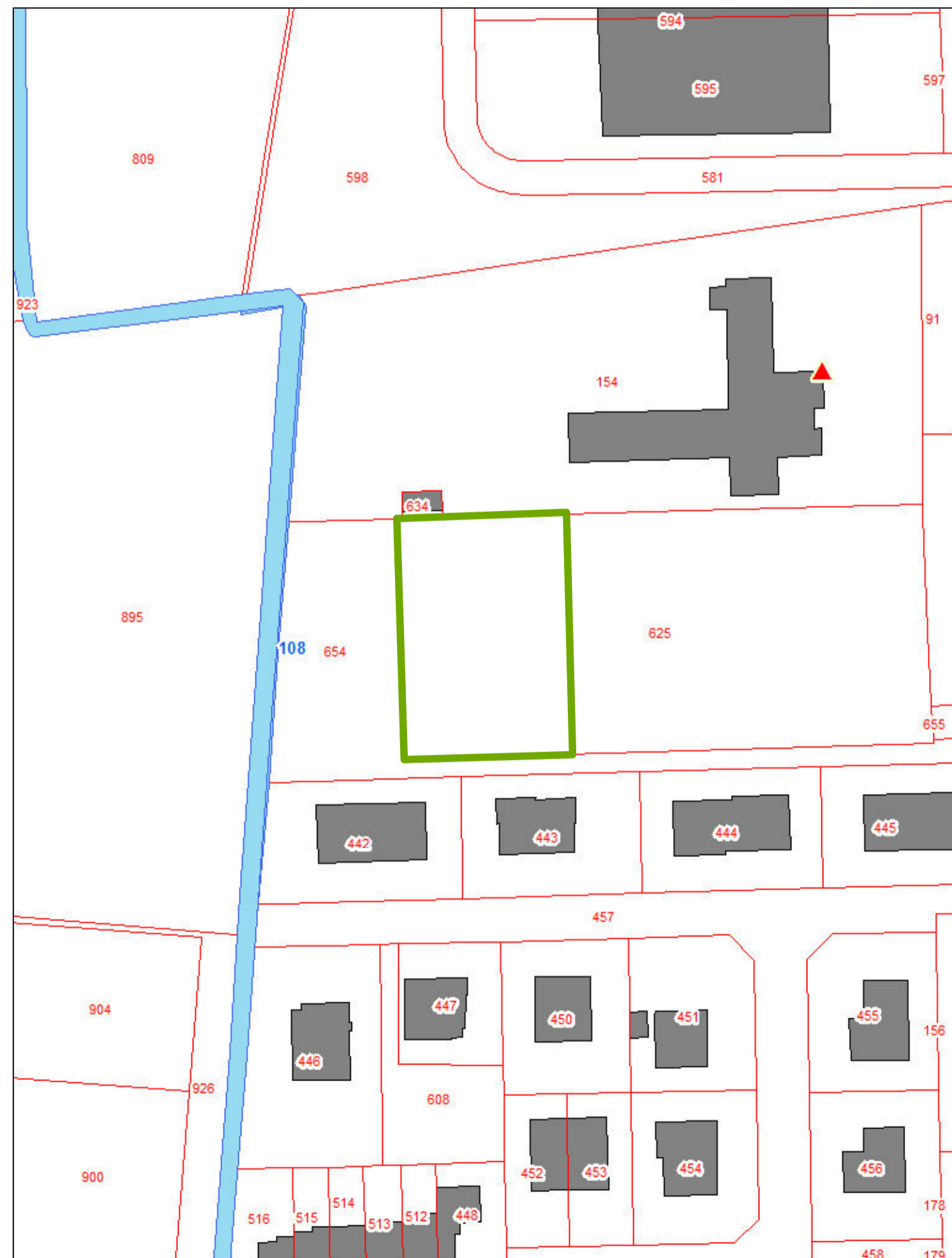
estratto catastale Fg. 108 map.le 625 parte (1.745m2)