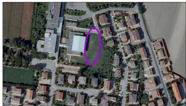
estratto ortofoto 0 25 50 100 150 200 Meters