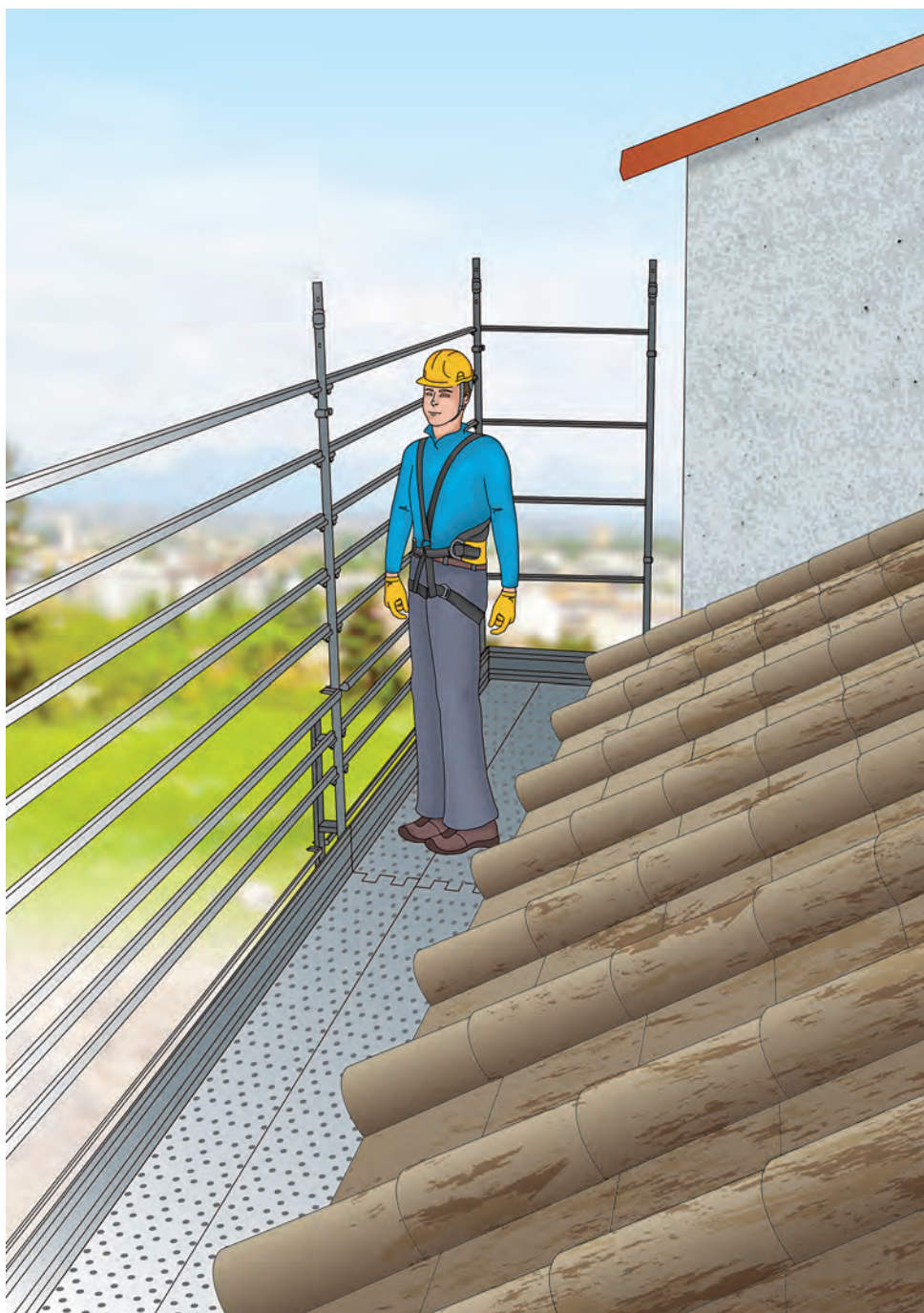
Figura 4 - Esempio di ponteggio utilizzato per la protezione dei bordi