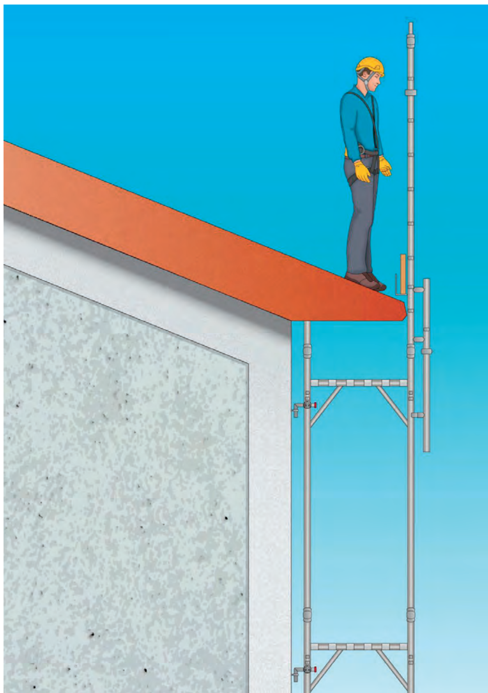
Figura 5 - Esempio di ponteggio utilizzato per la protezione dei bordi