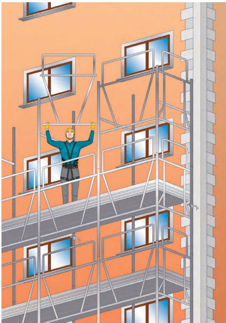
Figura 6 - Montaggio di un ponteggio con telaio parapetto (montaggio dal basso)