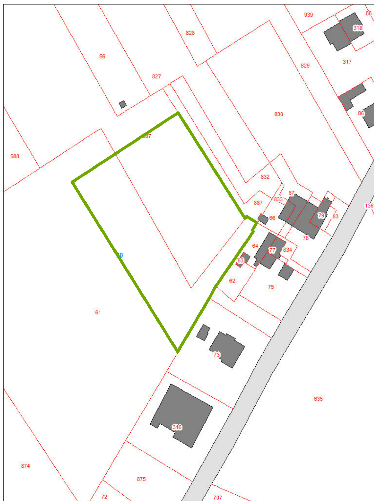
estratto catastale Fg. 30 map.le 587 parte (2.942m2) map.le 61 parte (2.888m2)