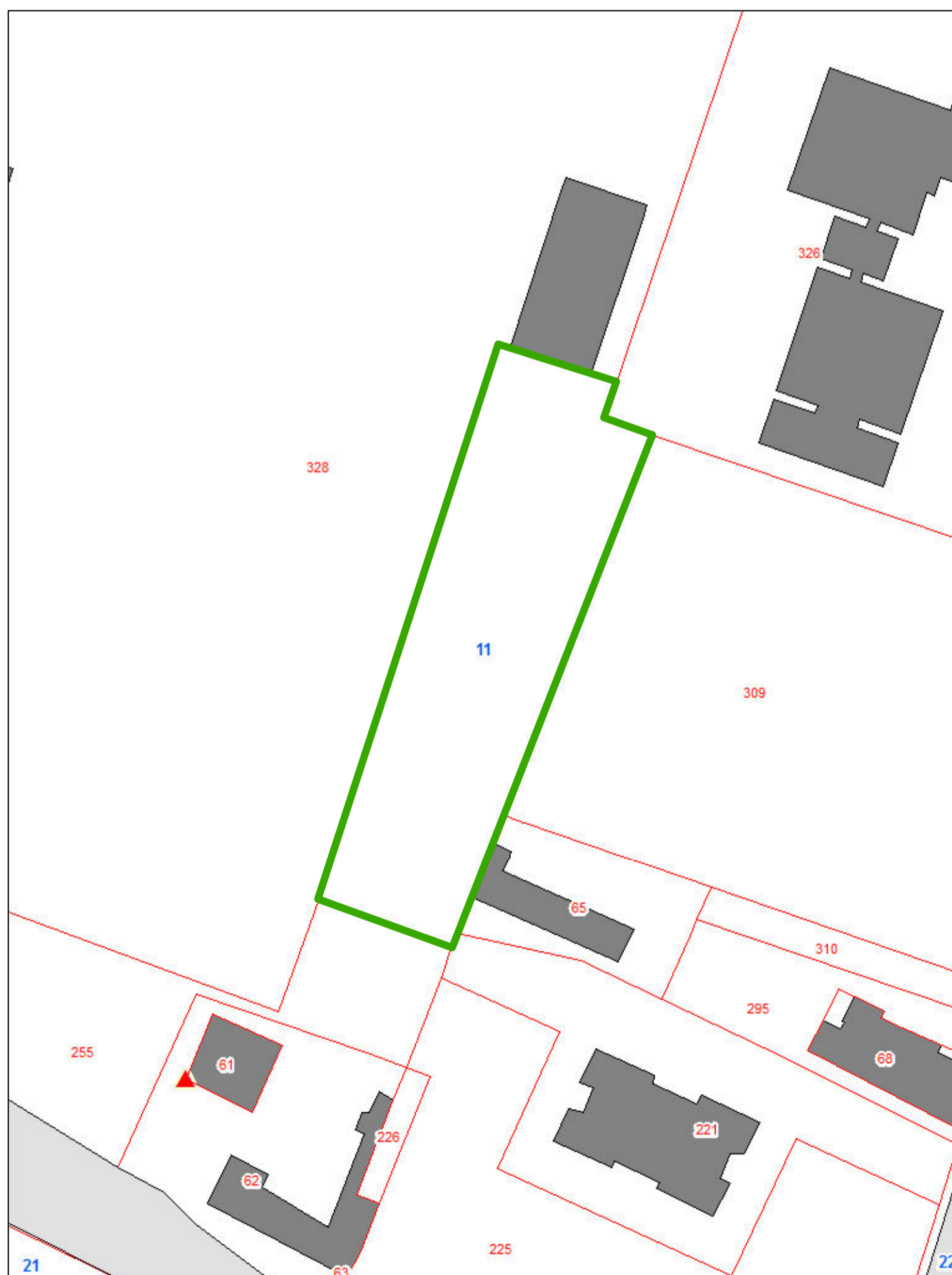
estratto catastale Fg. 11 map.le 328 parte