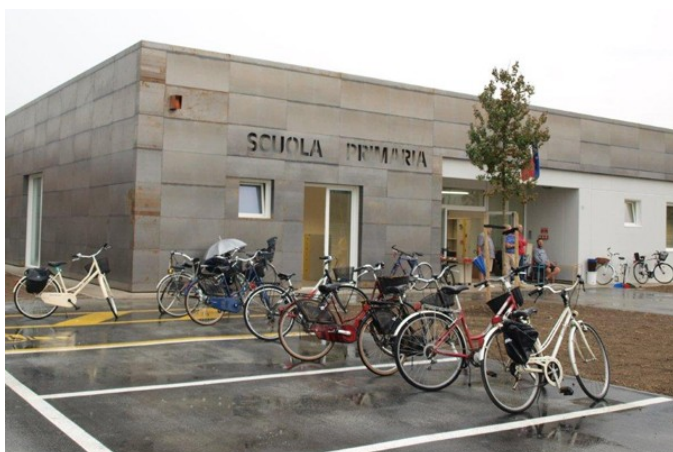
Rolo - nuova sede di via Cornaro

Alla data del 10 novembre sono ultimati tutti gli interventi (l'ultimo rallentato per subentrati problemi con a Sovrintendenza archeologica è previsto il 22 novembre ) ed in totale saranno così reinseriti in strutture nuove (EST e PMS), sicure e di qualità circa 18mila ragazzi e ragazze 8 . Grazie ai lavori di ripristino dei danni più lievi, si può stimare in circa 40-50mila il numero dei ragazzi che hanno potuto iniziare l'anno scolastico regolarmente.